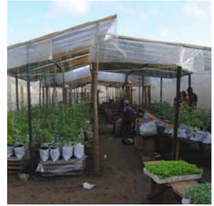
Figure 3.0 Systèmes hors-sol simplifiés pour le jardinage domestique et les jardins collectifs à Jérémie, à Haïti (en haut à gauche), à Trujillo au Pérou (en haut à droite), à Teresina, Brésil (au centre) et à Abidjan, en Côte d'Ivoire (en bas) (Orsini et al., 2013).

La FAO encourage fortement l'horticulture urbaine utilisant des systèmes hydroponiques simplifiés (Fig. 3) par le biais de micro-jardins, que l'on trouve de nos jours dans plusieurs pays d'Afrique, d'Asie et d'Amérique latine.