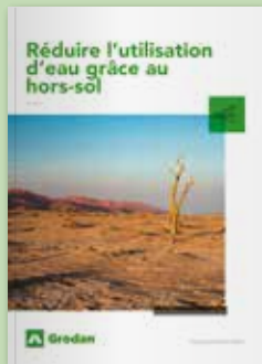
Réduire l'utilisation d'eau grâce à l'hydroponie