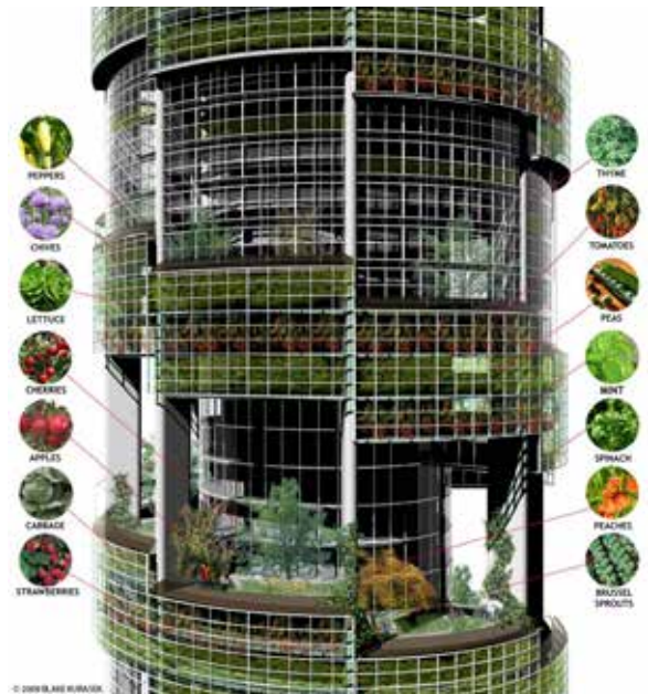
Figure 4.0 Contrairement aux idées reçues, les plantes n'ont pas besoin de terre pour pousser. Tant que les éléments nutritifs minéraux nécessaires sont introduits dans l'apport d'eau, on peut cultiver des plantes sans terre.

POIVRONS CIBOULETTE LAITUE CERISES POMMES CHOUX FRAISES THYM TOMATES PETITS POIS MENTHE ÉPINARD PECHES CHOUX DE BRUXELLES