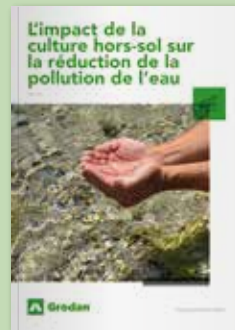
L'impact de la culture hors-sol sur la réduction de la pollution de l'eau