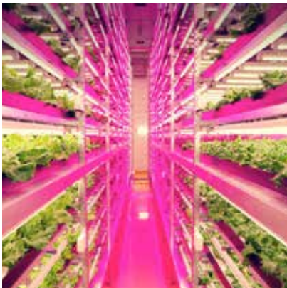
Figure 2.0 Plant factory, indoor farming or vertical farming, an example of urban agriculture which would fit in office buildings, basements, a parking garage etc.

Eigenbrod et Gruda (2015) concluent de leurs études que l'horticulture urbaine, c.-à-d., la production alimentaire urbaine, augmente dans le monde entier et, au niveau mondial, au moins 100 millions de personnes tirent une partie de leurs revenus directement de l'agriculture urbaine. Toujours au niveau mondial, l'horticulture urbaine se décline sous différentes formes, par exemple, jardins partagés destinés à la consommation personnelle (jardinage domestique), exploitations agricoles commerciales à grande échelle, jardins collectifs et même espaces paysagers composés de plantes comestibles. D'autre part, beaucoup d'espaces vacants peuvent être utilisés pour l'horticulture urbaine, comme les toits, les jachères, ainsi que des espaces plus réduits tels que les bords des routes ou les balcons privés.