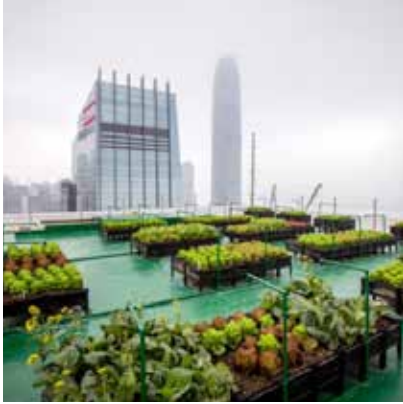
Figure 1.0 Roof top farming, being an example of urban agriculture (source: http://www.powerhousehydroponics.com/benefits-of-urban-farming/ )