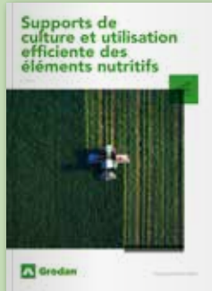
Supports de culture et utilisation efficiente des éléments nutritifs